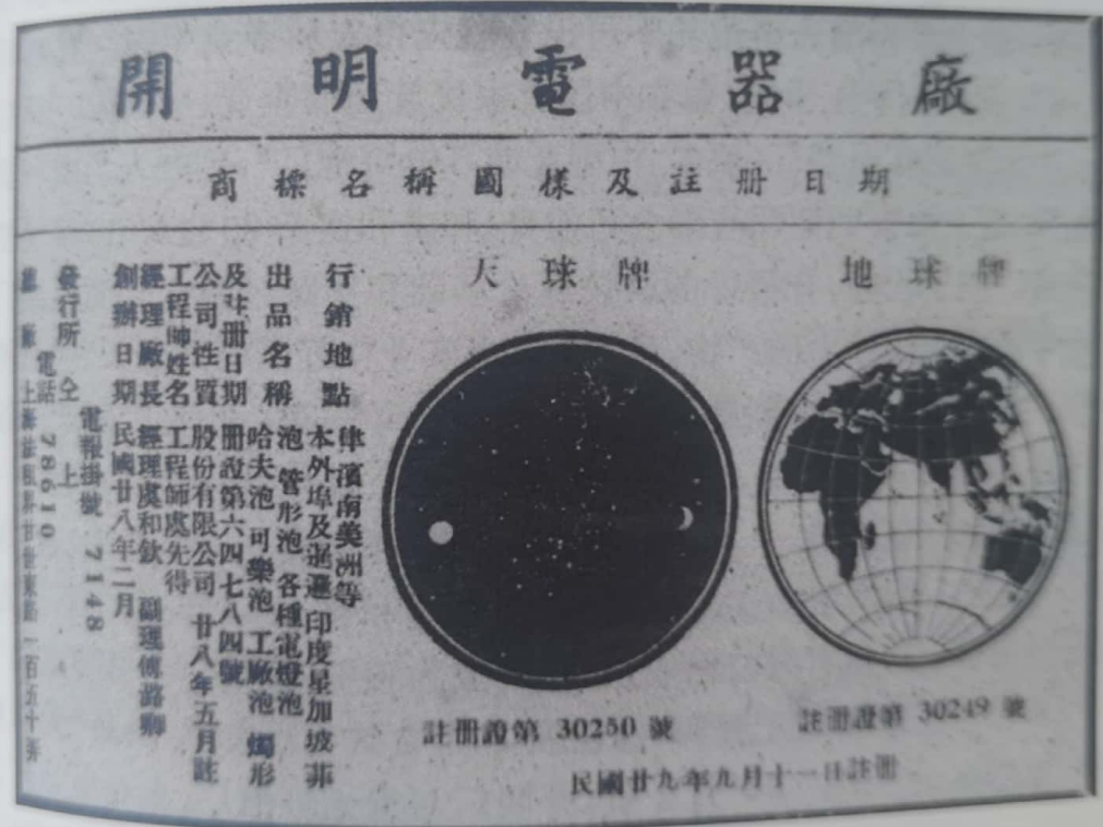
图6 开明电器厂股份有限公司第二次注册商标信息

1940年9月11日,开明电器厂股份有限公司再次进行商标注册。注册的商标名称仍为“天球牌”和“地球牌”,注册的出品名称为哈夫泡、可乐泡、工厂泡、梨形泡、管形泡等种类电灯泡,注册的产品行销地为本外埠及泰国、印度、新加