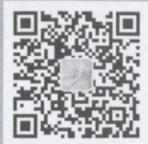
上海市 地方志办公室