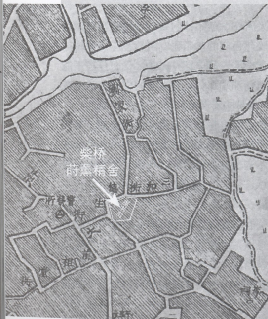
•虞和钦位于浙江镇海柴桥的“蒔薰精舍”位置图